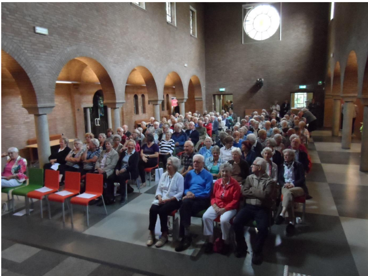
Bijeenkomst kapel Larenstein te Velp

Totale ureninzet in door de vrijwilligers van het Comité Dag van de Ouderen ruim 400 uur.