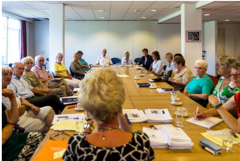
Terugkombijeenkomst vrijwilligers Trefpunt De Elleboog Velp

De coördinator is degene die deze scholingsbijeenkomsten organiseert en leidt. Zij bezoekt zelf ook geregeld congressen en cursussen om bij te blijven en feeling te houden met wat er speelt binnen het ouderenwerk.